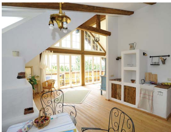
Bild 2: Für Einnahmen aus Privatzimmervermietung in Form von „Urlaub am Bauernhof“ steht ein eigener Freibetrag von € 3.700 zu.

Beiträge für Einnahmen aus Nebentätigkeiten sind am Ende des Kalendermonats fällig, in dem die Vorschreibung erfolgt. Die Vorschreibung erfolgt als Einmalbetrag spätestens mit der dritten Quartalsvorschreibung in dem Jahr, das dem jeweiligen Beitragsjahr folgt. Die Beitragsgrundlage aus Nebentätigkeiten wird grundsätzlich zur Beitragsgrundlage aus dem Urproduktionsbetrieb („Flächenbetrieb“) hinzugerechnet. Die Beitragszahlungen sind insgesamt durch die monatliche Höchstbeitragsgrundlage von € 5.985,- (Wert 2018) begrenzt.